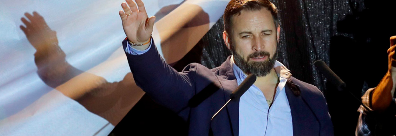
Santiago Abascal, líder de VOX .