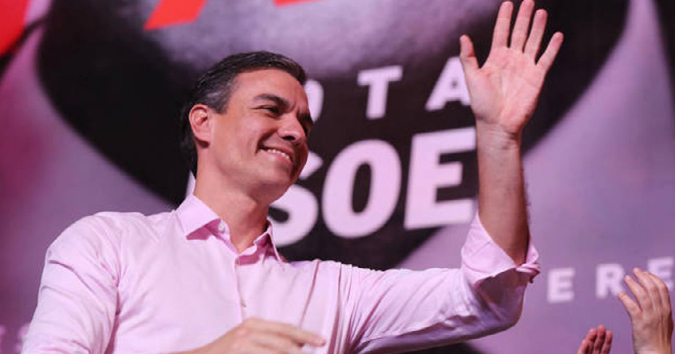
Pedro Sánchez, presidente del gobierno español y líder del PSOE, celebrando los resultados del 28-A.