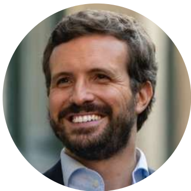
Pablo Casado Presidente Partido Popular @pablocasado_ 21/07

"Hoy hace 3 años fui elegido por primarias presidente del PP. Entonces éramos la 3ª fuerza y hoy ya somos la 1ª, hemos unido el partido, consolidado nuestro poder territorial y recuperado la hegemonía electoral del centro derecha. Volvemos a ser la esperanza de futuro para España"